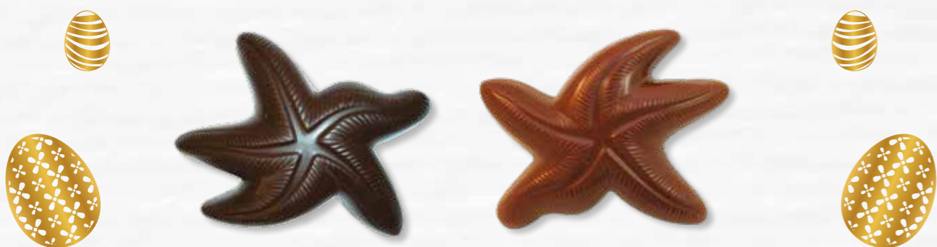
2 - Étoiles de mer