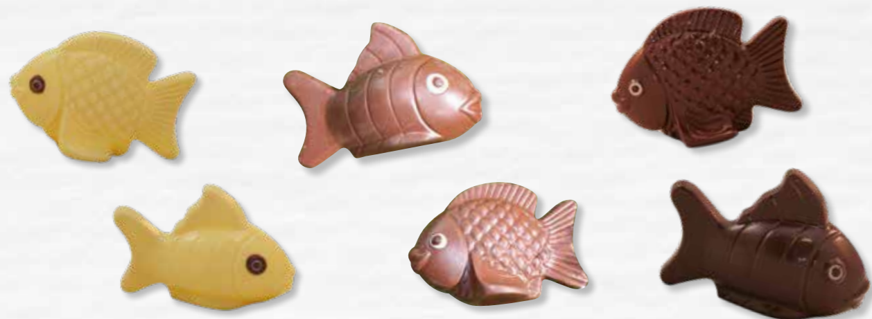
1 - Bubulles