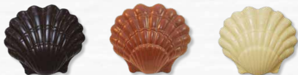
3 - Coquilles Saint Jacques