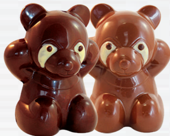
2- Ben l'ourson