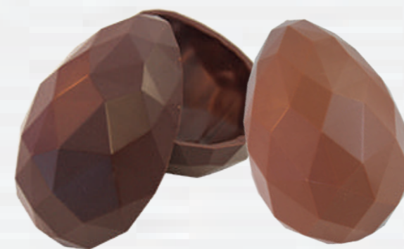
1- Œuf origami