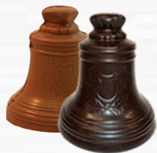
80 g - H. 11 cm