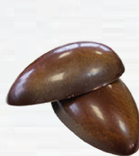
3- Œuf lisse croustillant