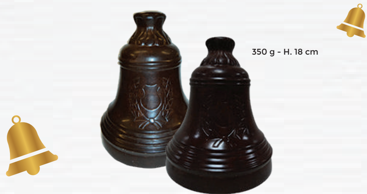
350 g - H. 18 cm