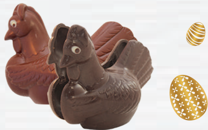
1- Sidonie la poule