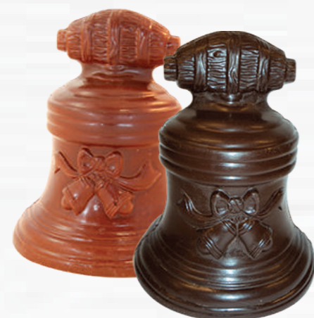
200 g - H. 15,5 cm