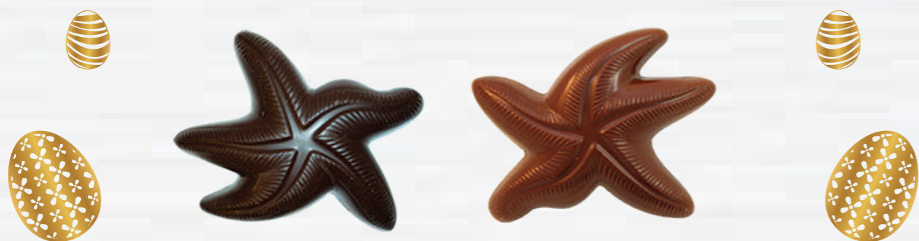
2- Etoiles de mer