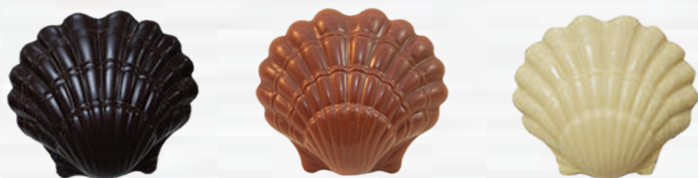
3- Coquilles Saint Jacques